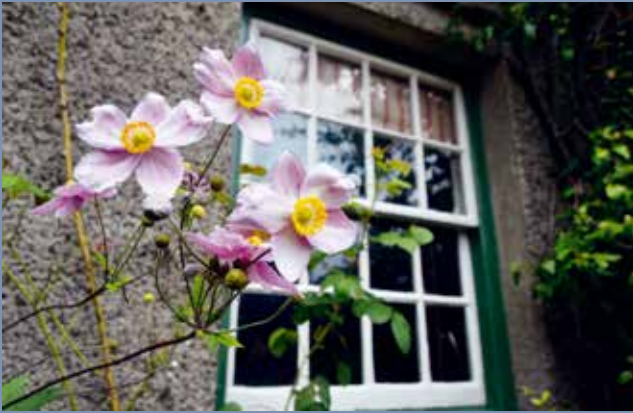
In de tuin zoom ik in op de ramen van het huis. Ondanks dat het onderwerp het raam op de achtergrond betreft, stel ik scherp op de bloemen op de voorgrond. Er wordt meteen een 'bruggetje' gemaakt naar beelden van het interieur. Een oude foto van Beatrix op een dressoir laat zien wie deze persoon in werkelijkheid was. Staand bij de ingang van haar woonhuis, genomen in de zomer van 1913.