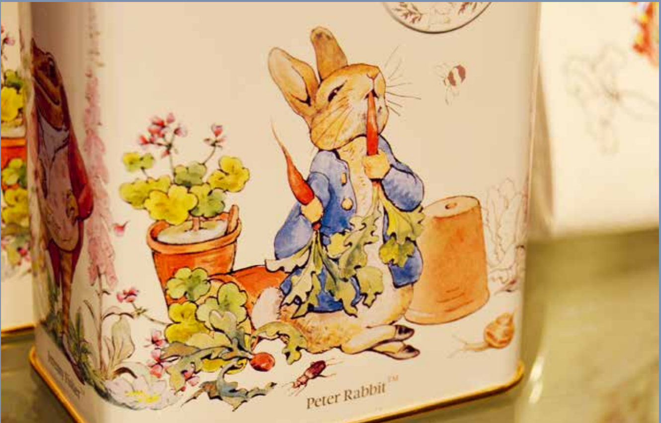
Beatrix patenteerde in 1903 een pop van Peter Rabbit. En dat legde haar geen windeieren. Het zorgde voor het begin van een enorme merchandise. Zoals tekenboeken, porseleinen theeserviezen, koekblikken, behangpapier, beeldjes tot aan babydekentjes toe.